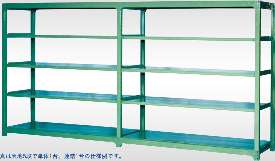
※写真は天地5段で単体1台、連結1台の仕様例です。