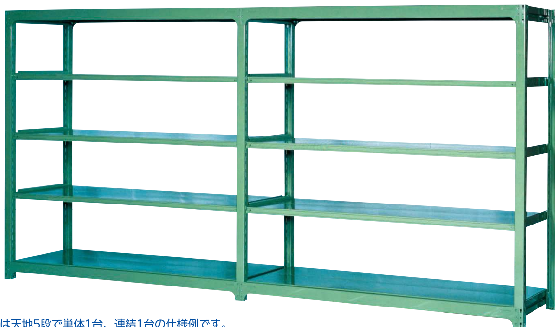
※写真は天地5段で単体1台、連結1台の仕様例です。