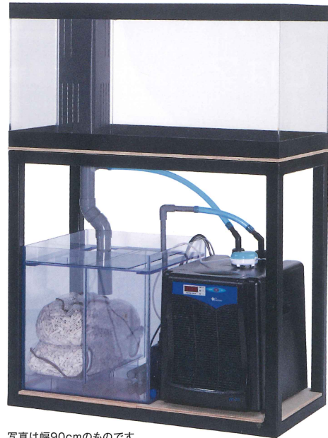
写真は幅90cmのものです