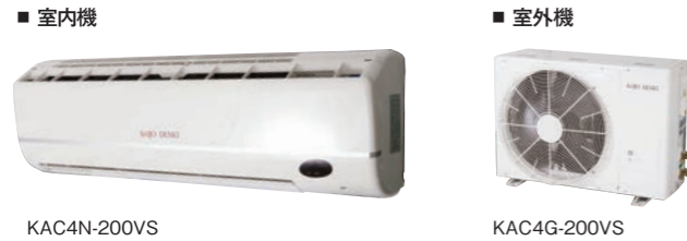
■ 室内機 KAC4N-200VS ■ 室外機 KAC4G-200VS