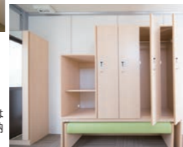
ロッカー下にはベンチが収納されています。

PR 動画公開中！ QRコードをスマートフォンでインターネットに接続してご覧ください。