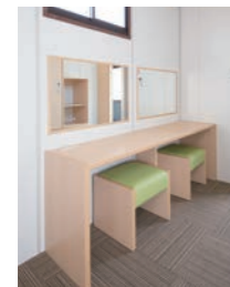
シャワールームには、脱衣所を別に装備しています。