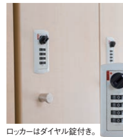
ロッカーはダイヤル錠付き。