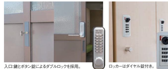
入口:鍵とボタン錠によるダブルロックを採用。