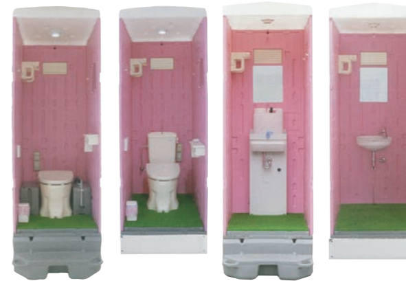
■軽水洗 LX-WCP+ ■水洗 LX-WR+ ■軽水洗 LX-LHP+ ■水洗 LX-LS+