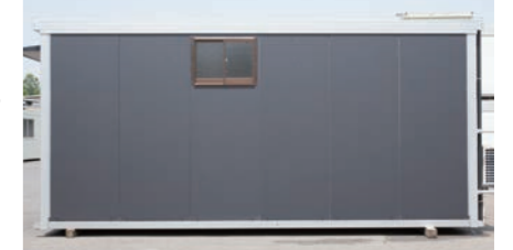
側面:側面には明かり取り用の小窓を配置。