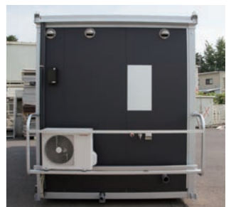
背面:電気・給排水口、給湯器用プレートを装備。