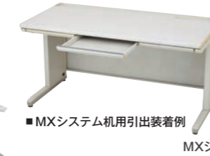
■MXシステム机用引出装着例