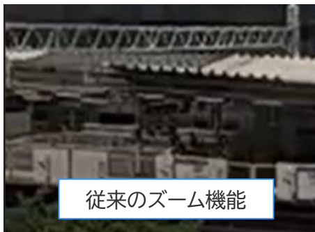
従来のズーム機能

最大倍率8倍までズームが可能。対象物に近づけない危険な場所（エレベーターシャフトや解体工事現場など）では遠隔撮影が可能。